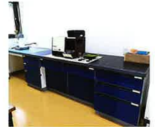
分析室 茶葉の成分分析等を行っています。 ご利用ください。