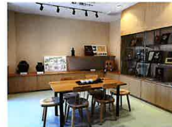
展示・試飲コーナー 茶道具等の展示。各種展示会等でのご利用も 可能です。(有料) 淹れたてのお茶をお楽しみいただけます。