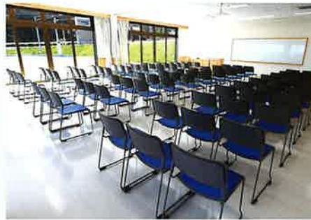
研修室 会議や研修会等に ご利用いただけます。 (収容人数:90名)

新施設では、これまでの機能に加え、新たに調理体験室・イベントスペース・茶畑などを整備し、より一層の茶業の振興を期待すると共に、より多くの方に、お茶の魅力を知っていただける施設としてさらなる向上を目指しております。