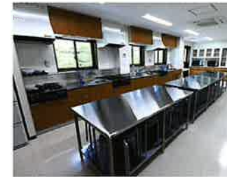
調理体験室 体験教室や茶葉を使った商品の試作などに ご利用ください。