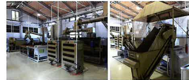
製茶機械(35K/1ライン) 製茶技術向上の研修や、品評会出品茶の製茶に ご利用いただけます。 工場がガラス張りであるため、 外からも製茶機械を見学することができます。